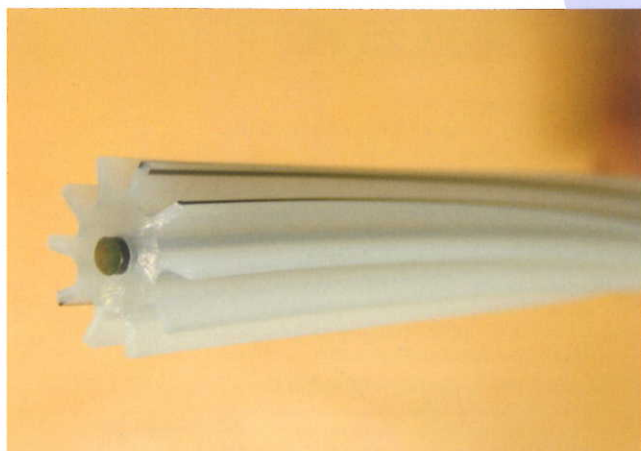
スロット Slotted Core