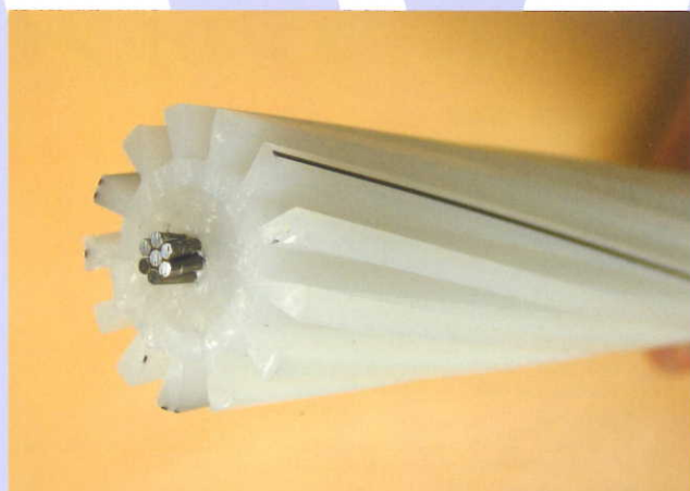
スロット Slotted Core