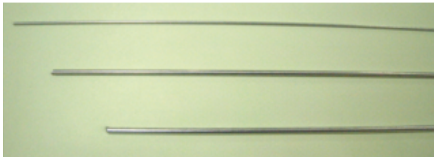
接着性樹脂塗布鋼線 Bonding Polymer Coated Wire for Drop Cable